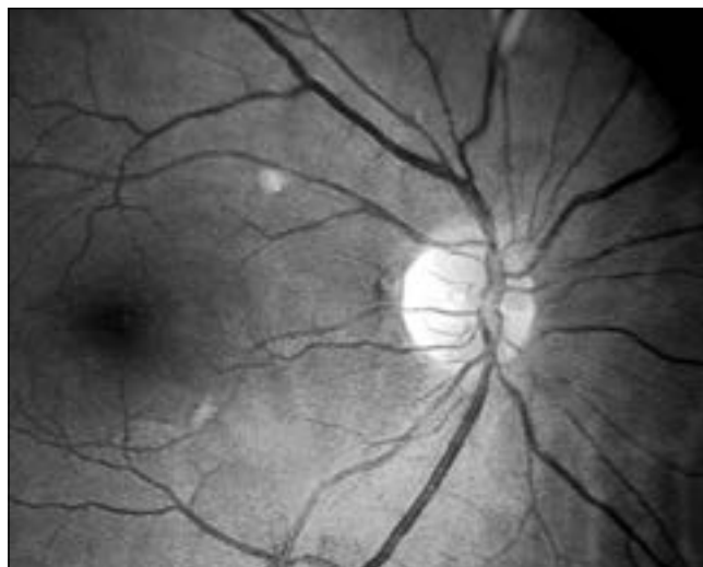
Рис. 1. Влажные экссудаты в макулярной области у пациентки с тяжелой степенью преэклампсии.