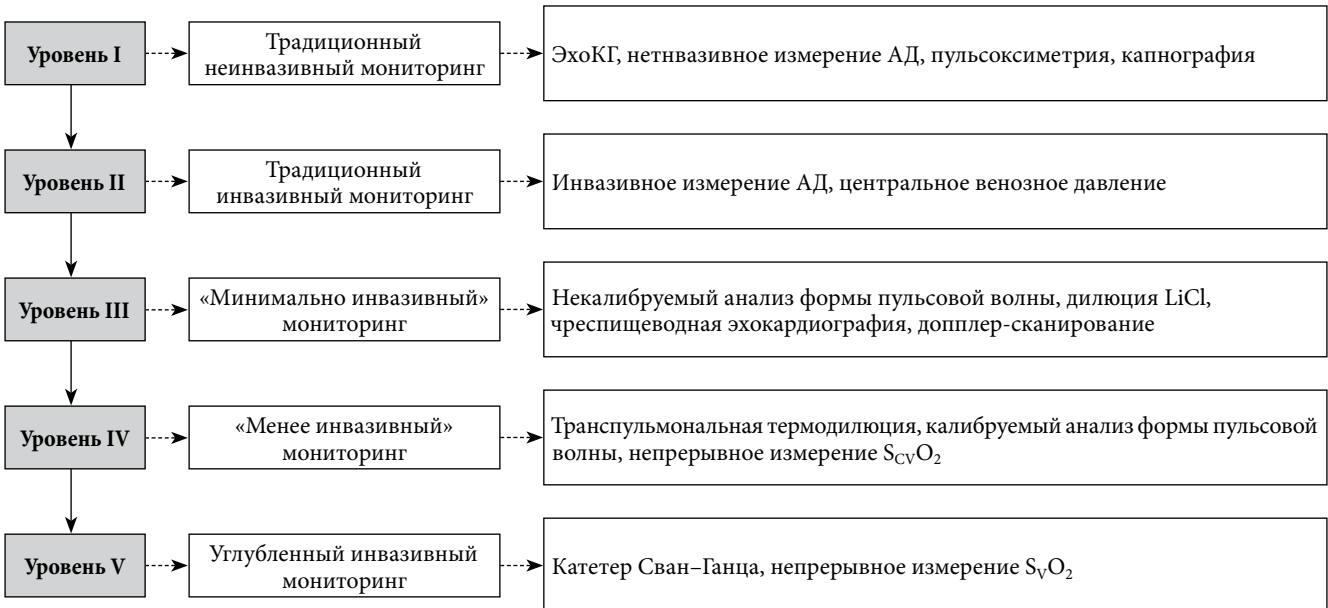
Рис. 2. Стратификация методов периоперационного мониторинга:

3 в случаях исходной легочной гипертензии и противопоказаниях к использованию либо ограничениях менее инвазивных методик гемодинамического мониторинга может быть целесообразна установка катетера Сван-Ганца.