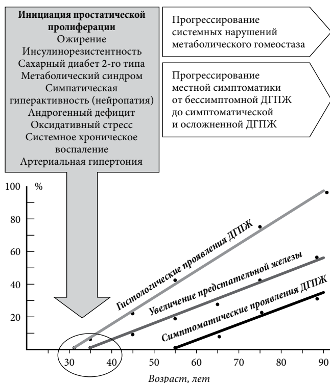
Рис. 1. Естественное течение ДГПЖ при увеличении возраста [5].

Следовательно, именно возрастной андрогенный дефицит (ВАД) может рассматриваться как один из ключевых патофизиологических механизмов реализации неблагоприятного влияния всех компонентов метаболического синдрома на предстательную железу. Иными словами, следует не только лечить ДГПЖ, но и корректировать по возможности все другие системные гормонально-метаболические факторы ее патогенеза, прежде всего, ВАД, учитывая выраженную гормонозависимость (и, прежде всего, андрогенозависимость) органа [2, 3, 11]. Именно ВАД стал «краеугольным камнем» современного учения о мультифакторном патогенезе СНМП/АПЖ и их патогенетической полимодальной персонифицированной фармакотерапии [4, 5, 9, 10].